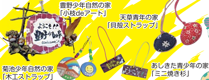
豊野少年自然の家 「小枝deアート」