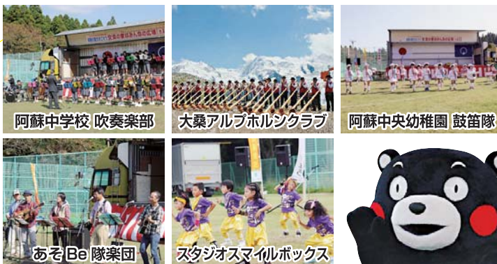
阿蘇中学校 吹奏楽部