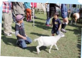
くまもんランド くまもとサブライズ 熊本県許可第2424号